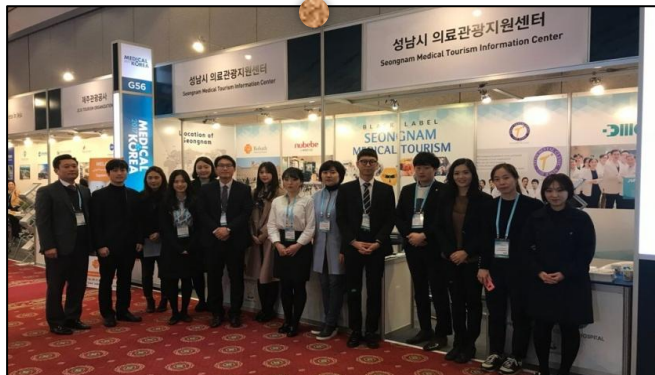
함께 고생하신 의료기관 관계자 분들과 함께! 😊