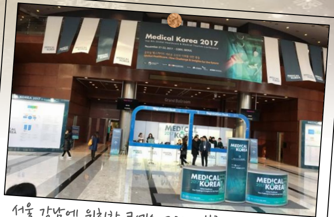
서울 강남에 위치한 코엑스 그랜드 볼룸에서 진행된 메디컬 코리아 2017 행사장 입구!

지난 11월 21일~22일 이틀간 보건복지부가 주최하고 보건산업진흥원이 주관하는 『메디컬코리아 2017』 행사에 성남시와 4개 협력의료기관이 “성남시 의료관광 지원센터”라는 이름으로 참가하였습니다.