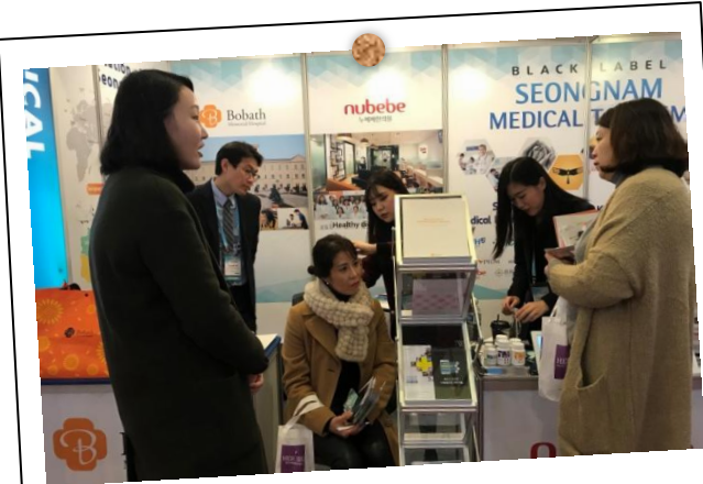
이번에 함께 참가한 4개 의료기관~♡ (보나스 기념병원, 누베베 한의원, 태평플러스치과의원, 분당제생병원)