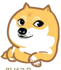
판선고우 (单身狗), 솔로

광棍(光棍)은 중국어로 애인이 없는 남자라는 뜻으로, '자의 모습이 외롭게 서있는 사람 모습과 비슷하다고 해서, 솔로를 채겨주는 문화로 확산되기 시작했습니다. '11이 두번 들어가 싱스데이(双十一)라고 쉽게 불리기도 해요.