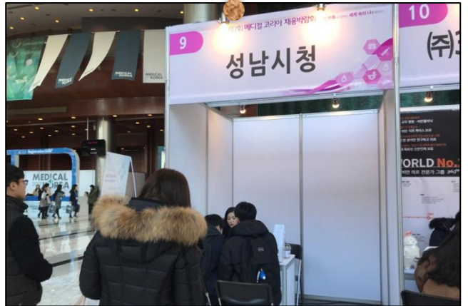
2017. 11. 21. 행사장 입구 앞에서, 채용박람회 의료관광 코디네이터, 의료관광 컨벤션 등을 위한 채용상담 진행!